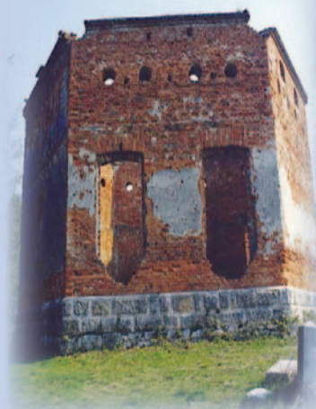
Prima e dopo il restauro del 2005