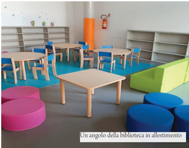
Un angolo della biblioteca in allestimento