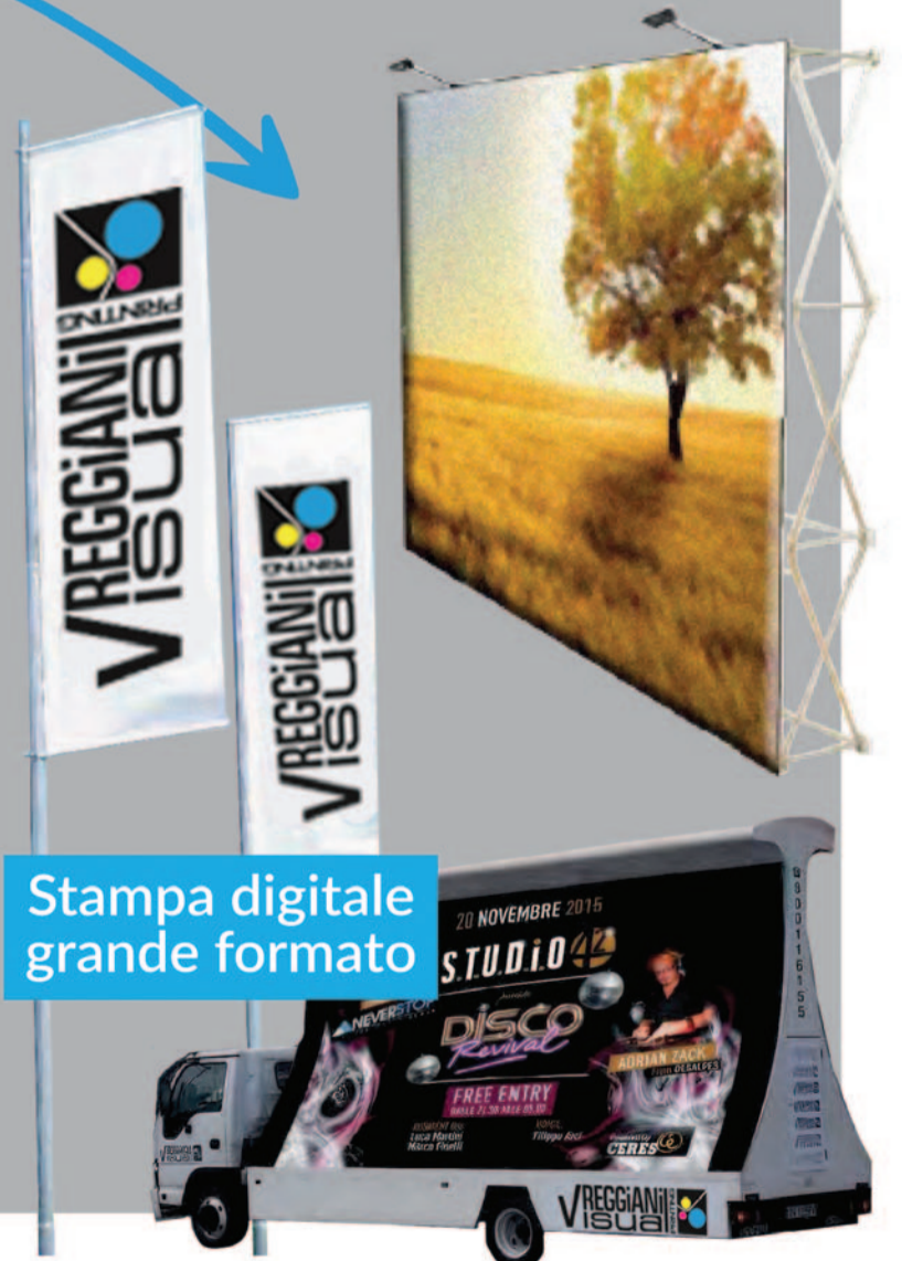
Stampa digitale grande formato