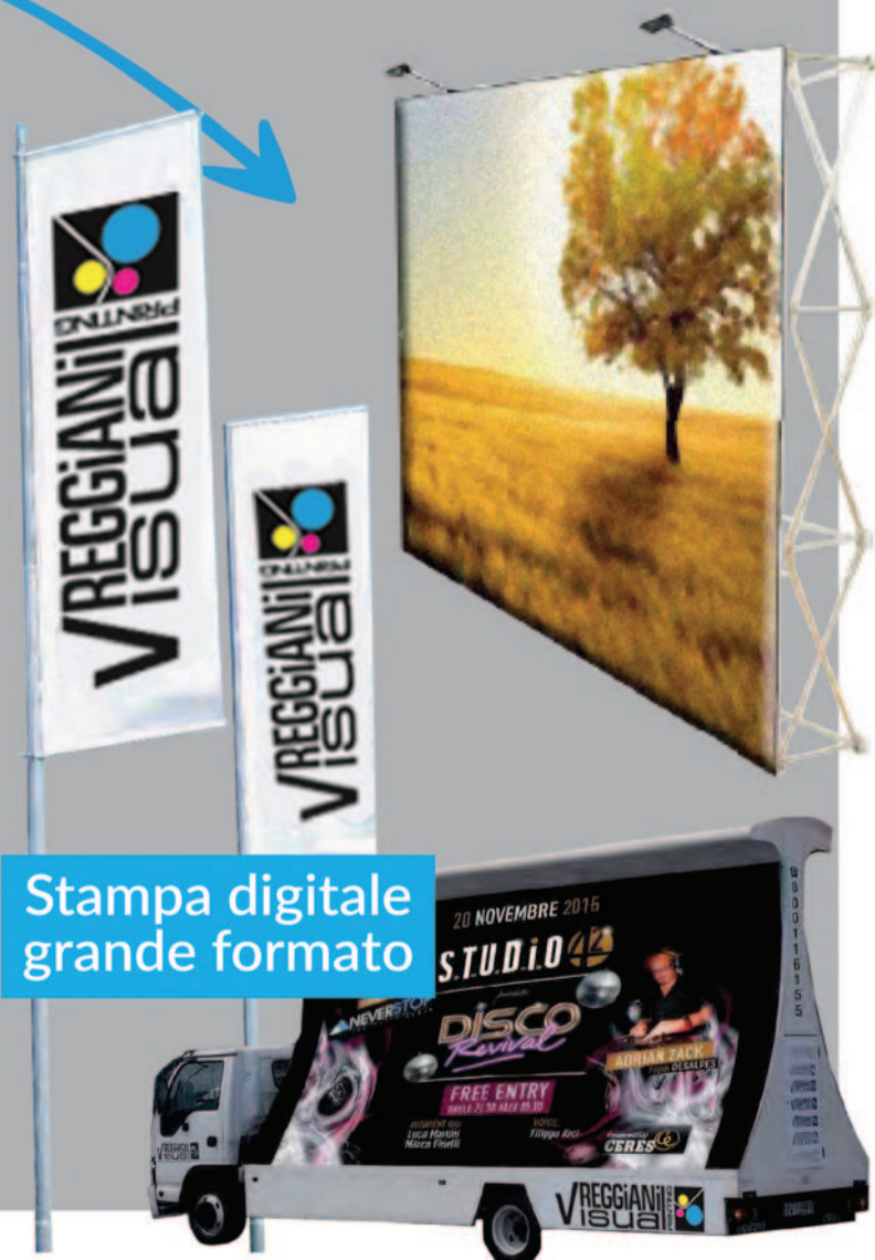
Stampa digitale grande formato