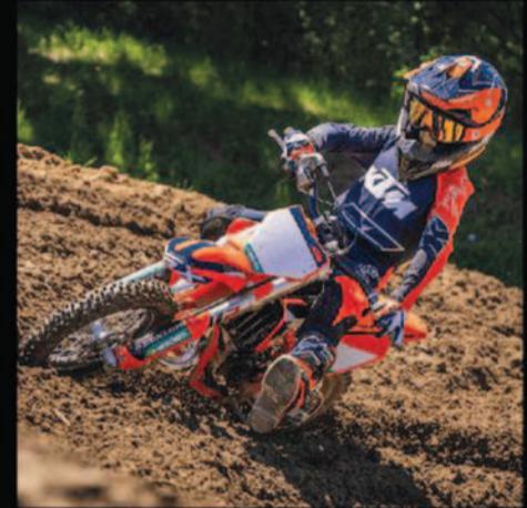
CORSI MINICROSS E MOTOCROSS