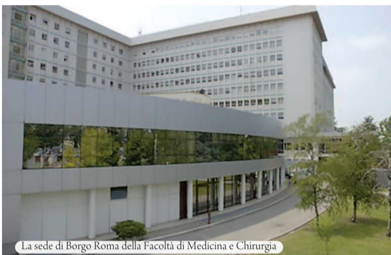
La sede di Borgo Roma della Facoltà di Medicina e Chirurgia