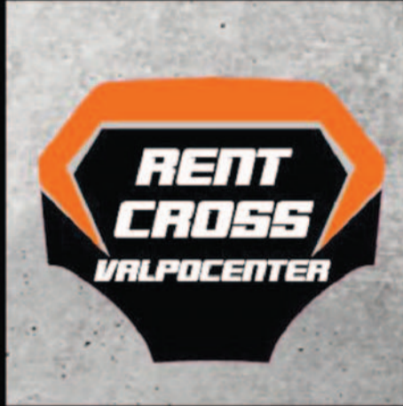
NOLEGGIO MOTO E ABBIGLIAMENTO