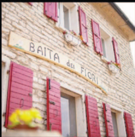
BAITA DEI FIORI AFFITTA CAMERE