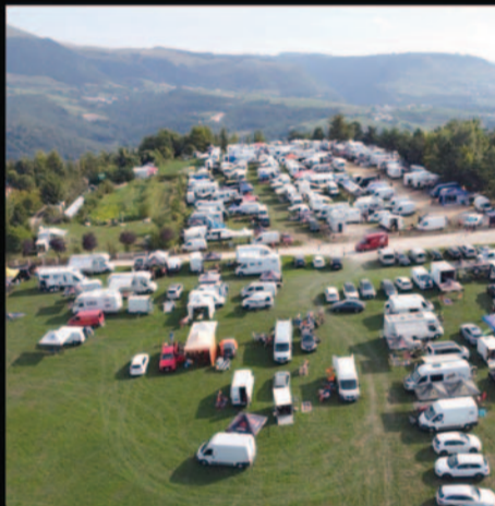
PARCHEGGIO SOSTA CAMPER