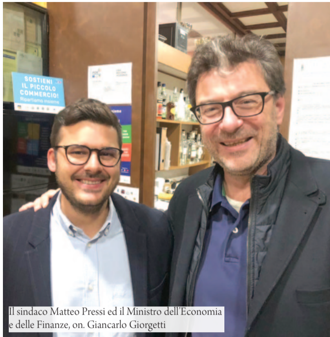
Il sindaco Matteo Pressi ed il Ministro dell'Economia e delle Finanze, on. Giancarlo Giorgetti

Il tema della gestione delle acque meteoriche sta diventando sempre più urgente in tutta Italia. Anche nel veronese esistono parti di territorio particolarmente fragili, come Soave, che nel recente passato ha subito diverse alluvioni, la peggiore nel 2010. Nel tempo sono stati realizzati diversi interventi volti a limitare i rischi di future esondazioni: dalla realizzazione del bacino di laminazione di S. Lorenzo al rifacimento dei muri di contenimento del fiume Tramigna, sino agli interventi di messa in sicurezza dei quartieri Cengelle e Poggio, realizzati lo scorso anno. «Un cantiere, quello della sicurezza idraulica, sempre aperto» - come evidenzia il sindaco di Soave Matteo Pressi, che in questi giorni ha ben tre motivi per guardare al futuro con maggiore serenità: «il nostro Comune ha ricevuto la notizia dell'assegnazione da