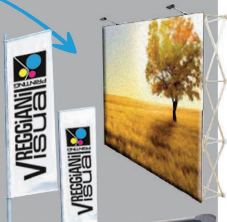
Stampa digitale grande formato