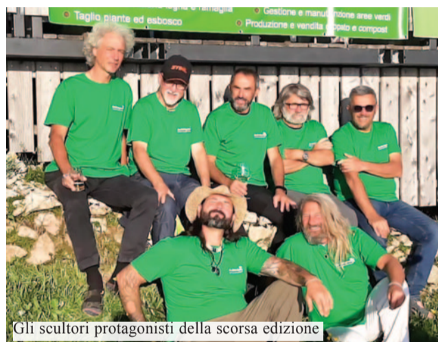
Gli scultori protagonisti della scorsa edizione

è stato infatti ideato per creare, per diletto e per divertimento, qualcosa che potesse rimanere sul Baldo. Non sappiamo ancora esattamente cosa realizzeremo...la magia della montagna ci porterà consiglio...Ma in questo 2025 ci sarà anche una piacevole novità: sabato 21 giugno verrà proposta una serata speciale aperta a tutti, 'A cena con gli scultori': una cena in rifugio in compagnia dei protagonisti di 'Scultori in quota'. Un'occasione per ascoltare le loro storie e vivere l'atmosfera unica del rifugio tra arte, natura e buon cibo. S.A.