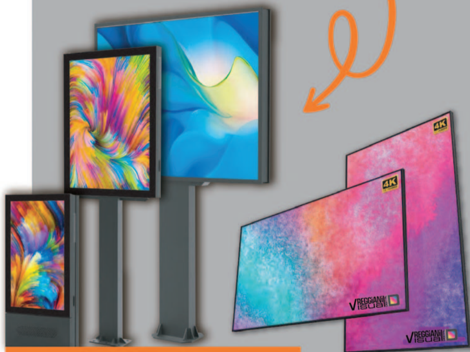
entra nel mondo Digital