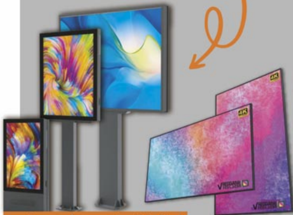
entra nel mondo Digital