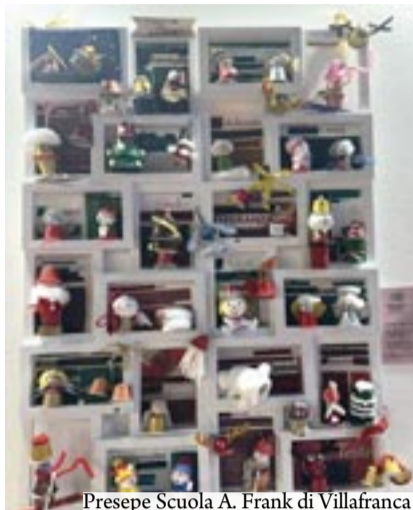
Presepe Scuola A. Frank di Villafranca

La Pigotta sez. Grandi e Medi del comune di Castelnuovo sul Garda, scuola primaria A. Frank classe 3A del Comune di Villafranca di Verona, scuola primaria Beni-Montresor classe 2D del comune di Bussolengo, scuola primaria F. Baracca classi 1A e 1B del comune di Pescantina,