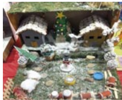
Presepe Scuola Beni-Montresor di Bussolengo

La Pigotta sez. Grandi e Medi del comune di Castelnuovo sul Garda, scuola primaria A. Frank classe 3A del Comune di Villafranca di Verona, scuola primaria Beni-Montresor classe 2D del comune di Bussolengo, scuola primaria F. Baracca classi 1A e 1B del comune di Pescantina,