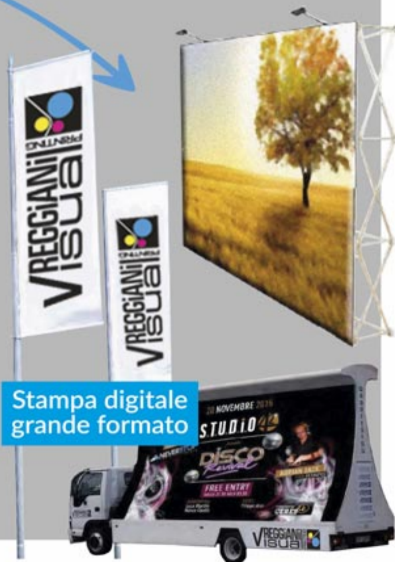
Stampa digitale grande formato