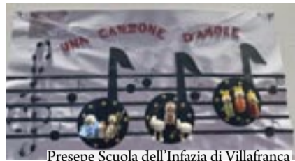
Presepe Scuola dell'Infanzia di Villafranca

Sabato 11 gennaio, nella Chiesa di San Procolo a Verona, sono state premiate le 11 classi selezionate dalla giuria della XX edizione della mostra-concorso 'Presepi e Paesaggi in materiale riciclato' promossa dal Consiglio di Bacino Verona Nord in collaborazione con Serit e il Consorzio di Bacino Verona Due del Quadrilatero. L'iniziativa di educazione ambientale è stata rivolta a tutte le scuole di ogni ordine e grado dei 58 Comuni del bacino Verona Nord e prevedeva tre premi per le scuole dell'infanzia, tre per le scuole primarie, tre per le scuole secondarie di primo grado e due premi speciali. Tra gli oltre cento presepi e paesaggi realizzati con materiali di recupero o di scarto, esposti sino al 6 gennaio nella Loggia del Consiglio in Piazza dei Signori, le undici opere selezionate dalla giuria provengono da tutta la provincia: scuola dell'infanzia Bettina Pasqualini sez. Ninfee del comune di Cavaion Veronese, asilo infantile Tubaldini sez. Pesciolini Rossi del comune di Grezzana, asilo nido