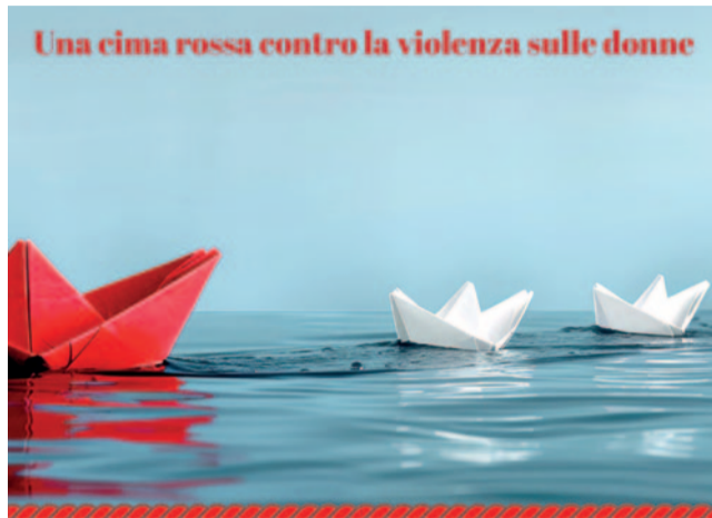
Una cima rossa contro la violenza sulle donne

In occasione della Giornata Internazionale per l'eliminazione della violenza contro le donne, il 25 novembre è partito ufficialmente il progetto 'Una Cima Rossa per Fermare la Violenza sulle Donne'. Giunta al suo secondo anno e promosso dalla Lega Navale Italiana, l'iniziativa è organizzata in collaborazione con il Comune di Garda e Lares Italia (Laureati Italiani Esperti in protezione Civile), con il sostegno di numerosi enti e università. Il progetto mira a sensibilizzare la comunità sull'importanza di combattere ogni forma di violenza di genere. Protagonista dell'iniziativa